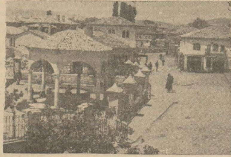
Çerkeşten bir köşe

doğru değildir. Çerkeşin pek çok ihtiyacları vardır. Bol su, elektrik, otel, lokanta, Halkevi binaları başlıcalarını teşkil eder.