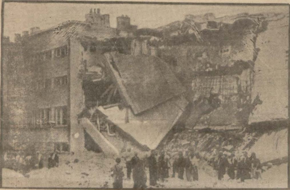
Londra, 13 (Hususî) — Günün en mühim hâdisesi bir Alman resmi tebliğinin doğurduğu meseledir.

Tatbıkına başlanan ve harbin fecaatini büsbütün artıran bu karara sebep Leh halkının Alman ordusuna bütün kuvvetile karşı koymasidir